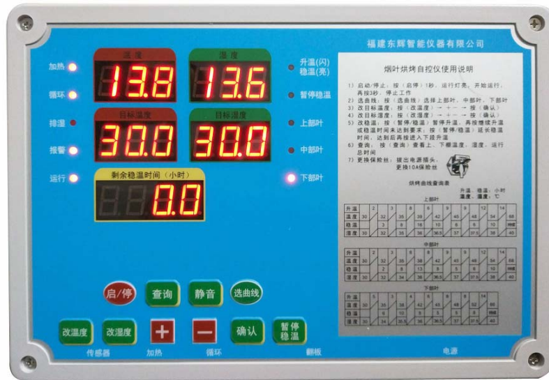
A 型：无短信通知功能